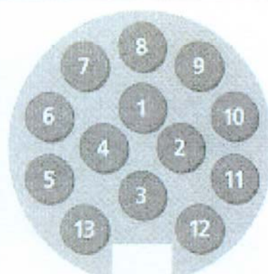
Ansicht von hinten

Angaben ohne Gewähr und Haftungsausschluß für eventuelle Schäden